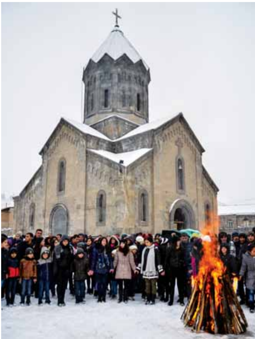
14 փետրվարի 2017թ., Տեառնընդառաջը Գորիսում, որի կազմակերպմանն ակտիվ մասնակցություն ունեցավ Առուշ Առուշանյանը:

– Տաթևի վանական համալիրն ամեն տարի դեպի իրեն է ձգում հարյուրավոր զբոսաշրջիկների՝ աշխարհի տարբեր անկյուններից: Նրանք ցանկանում են նաեւ հնայվել վանքի մերձակայքում գտնվող Չարանց անապատով: Բիբլիական հրաշք անկյունը գնալ բոլորին չի հաջողվում, քանի որ Ստաանայի կամրջից ձգվող կաժան-ճանապարհը դժվարանցանելի է եւ ոչ բոլորի համար հաղթահարելի: Ստաժում ենք այդ մասին, գուցե մի օր մեզ հաջողվի լուծել այդ հարցը: Իսկ խնելու ջրի հարցն արդեն լուծել ենք, եւ զբոսաշրջիկը ծարավը հագեցնելու համար խնդիր չի ունենա: Ատում ենք՝ Չայաստանը թանգարան է բաց երկնքի տակ: Դա արքայի մասն է: Այդպես միայն ասել ու հպարտանալ, քիչ է: Պետք է գործենք եւ այն էլ այնպես, որ զբոսաշրջիկը երկար մնա մեզ մոտ՝ մեր սպասարկման, մեր վերաբերմունքի շնորհիվ նաեւ: Այնինչ, կան որոշ վայ սպասարկողներ, ովքեր, տեսնելով զբոսաշրջիկի, մտածում են նրանից ավելի շատ գումար վերցնելու մասին: Դա անբարոյակամություն է եւ խփում է մեր ազգի նկարագրին: Այդ նույն զբոսաշրջիկը, գնալով իր երկիրը,