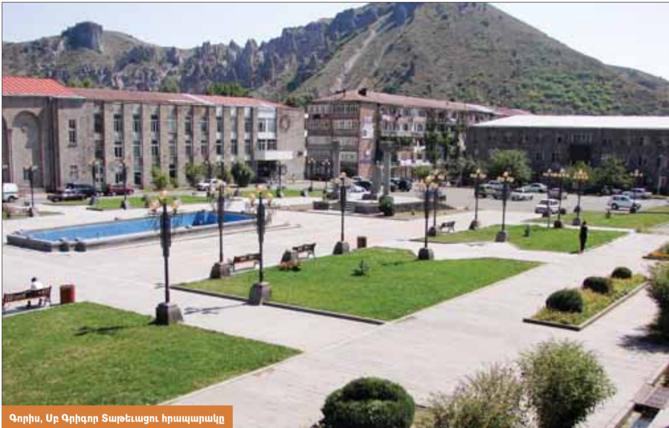
Գորիս, Սբ Գրիգոր Տաթևազուցի հրապարակը