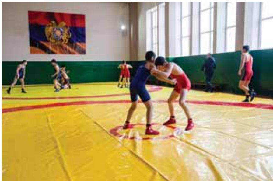
15 փետրվարի 2017թ., վերաբացվեց Գորիսի ըմբշամարտի մարզադահլիճը՝ հիմնանորոգումից հետո:

– Կեղծավոր մարդը դերասան է: Դա, գիտենք, աշխարհը բեն է, մենք էլ՝ դերասան: Ուղղակի ցավալին այն է, որ մեզ մարկանց մոտ դերասանությունը չափ ու սահման չունի: Նրանք տեղ