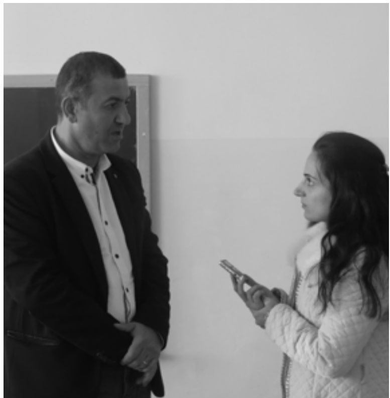
ՉԱԽՈՒՄ ՍԵՐՐՈՎ ԿԱՐՈՒՆԱՅԱՆ

րատորիաների հետ: Այստեղ շատ կարևոր են նաև աշակերտների գիտելիքները մաթեմատիկա, ֆիզիկա առարկաներից»: