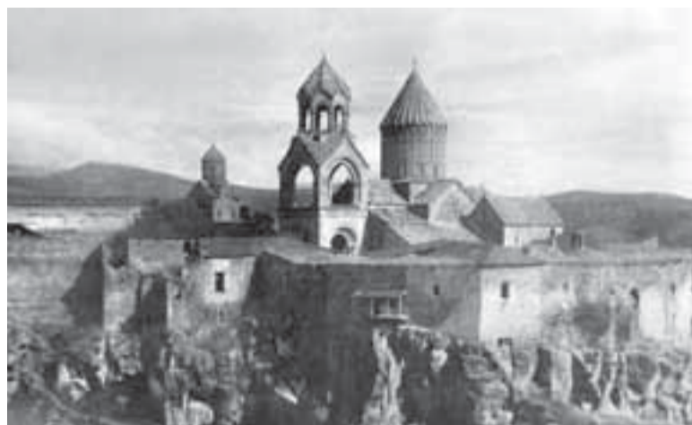
Տաթևի վանք, 1931թ. երկրաշարժից առաջ

հավաստի վերականգնում՝ ռեստավրացիայի բոլոր օրենքներին համաձայն: ԽՍՀՄ տարբեր երկրների ներկայացուցիչներից կազմված հանձնաժողովը սա համարեց բացառիկ երեւոյթ, ի վերջո նախագիծն արժանացավ առաջին կարգի դիպլոմի: «Սա, իհարկե, ԽՍՀՄ ռեստավրացիայի բնագավառում առանձնահատուկ էր, հետեւաբար նաեւ պատվարներ եւ վարչության, եւ Հայաստանի համար», – նշեց վերականգնող ճարտարապետ Ամիրան