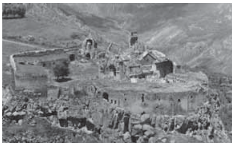
Տաթևի վանք, 1931թ. երկրաշարժից հետո