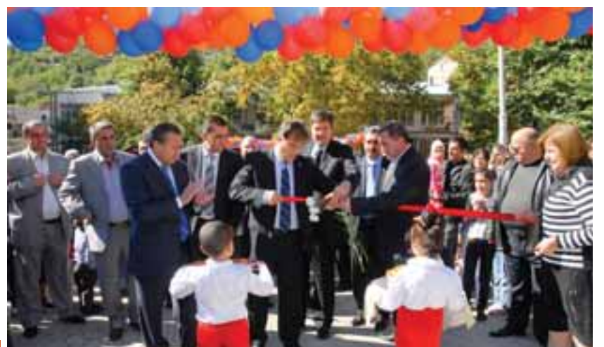
2011թ. հոկտեմբերի 2-ին Շահումյան փողոցում բացվեց Խաղաղության պուրակը: