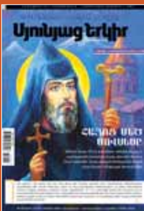
Մովսես Խորանանցի (Տաթևացի), Ամենայն հայոց 101-րդ կաթողիկոս, հայոց ազգային-եկեղեցական վերջին սուրբը (2015թ.)