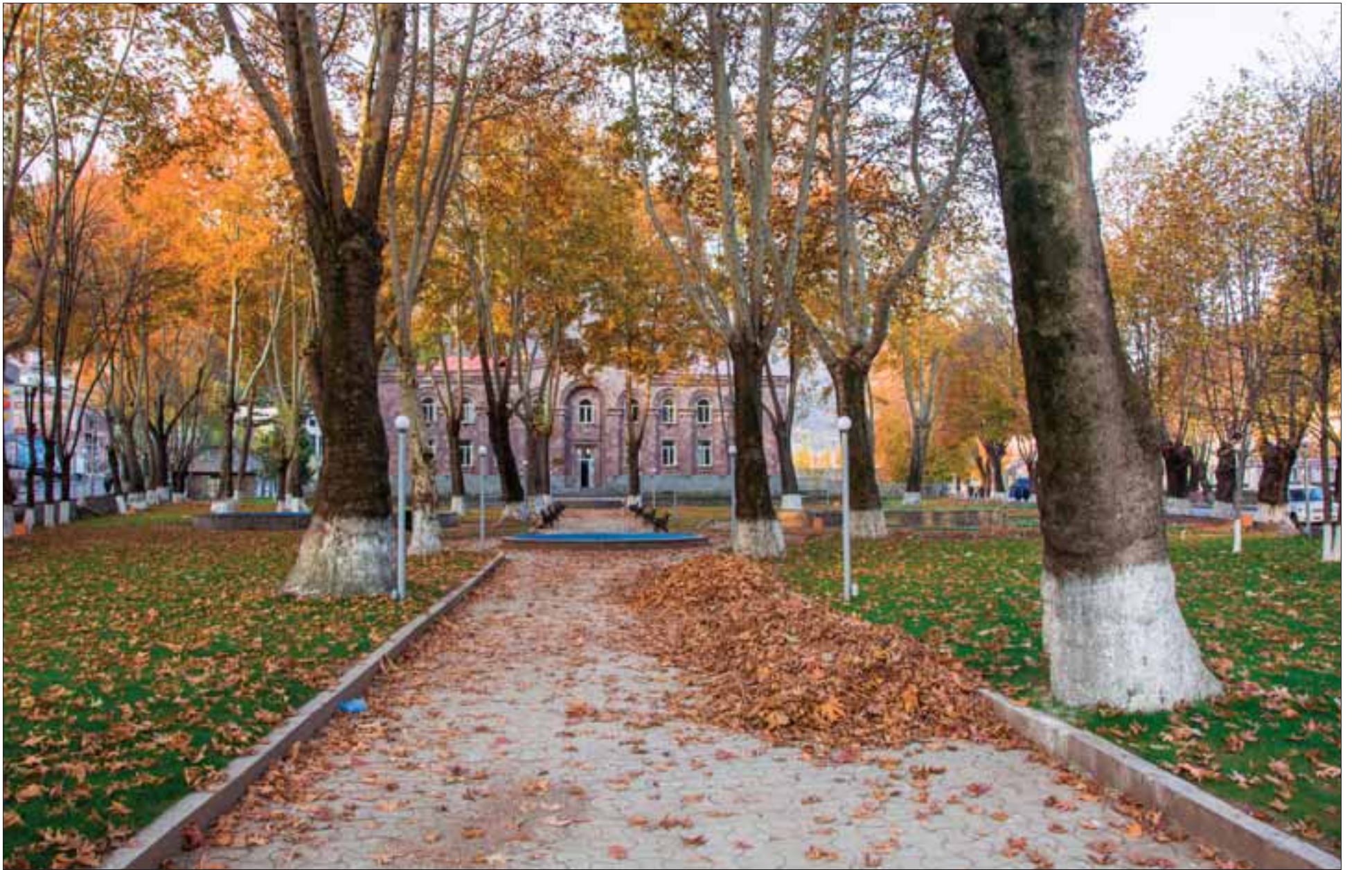
ԼՍԻՍՆԱՎՈՐԸ Գ. ԱՄԵՐԱՔԱՆԻ