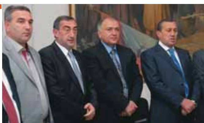
Սյունիքի մարզպետ Սուրեն Խաչատրյանի եւ ՀՀ տարածքային կառավարման նախարարի տեղակալ Վաչե Տերտերյանի հետ «Կապանյան օրեր» ավանդական տոնակա- պարության ժամանակ (2011թ.):