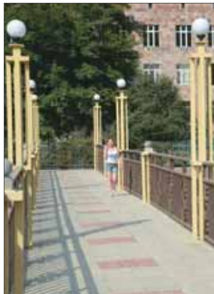
Նոր փուլը՝ ներհամայնքային ճանապարհներին, կամուրջներին ու անցումներին. 2008-12թթ. Կապանի քաղաքապետ Ա.Աթայանի իրականացրած ծրագրերից էր դա