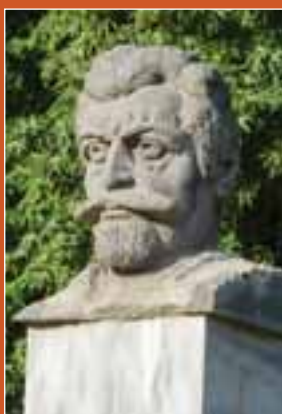
Արամ Մանուկյանի կիսանդրին՝ քաղաքի կենտրոնում (2009թ.)