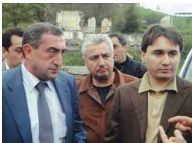
ՀՀ փոխվարչապետ, տարածքային կառավարման նախարար Արմեն Չելոբյանի հերթական հանդիպումը Կապանի քաղաքապետ Արտուր Աթայանի հետ (2011թ.):

հնչպես յուրաքանչյուր մարդ ու անհատ, այնպես էլ նա, գալիս է մանկությունից: Իսկ այն պարզ, հասարակ ու մաքուր էր: Արտուր Աթայան անձ-անհատի ձեւավորումը խարսխվեց իմաստուն տատի եւ բարի ու ազնիվ մոր դաստիարակության վրա: Դրան ավելացան հայ եւ համաշխարհային գրականության մեծերի գործերը, որոնք նա կարդում էր սկսած դպրոցական վաղ տարիներից: Բալզակի, Յյուզոյի, Ռեմարկի, Րաֆֆու,