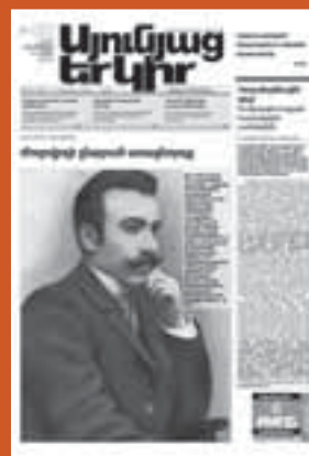
Նշվեց Սմբատ Մելիք-Սյրեփանյանի 130-ամյակը (2009թ.)