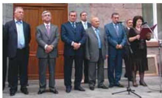
1 սեպտեմբերի 2009թ., ՀՀ նախագահ Սերժ Սարգսյանի մասնակցությամբ վերաբացվում է քաղաքի N3 դպրոցը՝ հիմնանորոգված մոսկվայաբնակ կապանցի, բարերար Սերգեյ Համբարձումյանի կողմից: