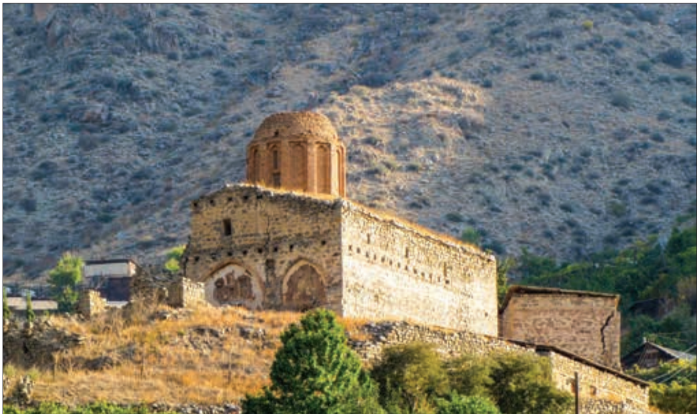
Մեղրի, Սբ. Հովհաննես Եկեղեցի (Առապատանաց վանք)

– Չեմ կարծում՝ թեկնածուն առաջադրվելիս պետք է նախապես որոշի իր առաջին քայլը, այն է՝ օրենսդրության ոլորտում, որովհետև մինչ իրավիճակը խորապես չուսումնասիրես, տեղյակ չլինես ընդհանուր մոտեցումներին, չես կարող ճիշտ քայլեր ձեռնարկել: Բոլոր հարցերում իմ