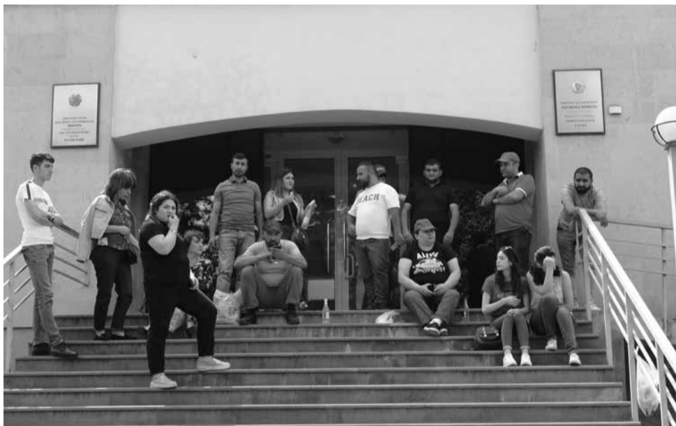
20 մայիսի 2019թ., Կապան

Դատարանի մուտքը փակելու հետ մեկտեղ (թեեւ որեւէ մեկը չի էլ փորձում մուտք գործել դատարանի շենք) նրանք բարձրացնում են նաեւ դատական իշխանությանն առնչվող եւ իրենց մտահոգող հարցեր: