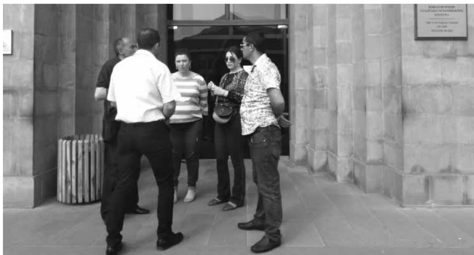
20 մայիսի 2019թ., Գորիս

Մասնավորապես՝ մեկ տարի շարունակ Մեղրիում դատավոր չկա, եւ ոչ մեկին, կարծեք, այդ խնդիրը չի մտահոգում: