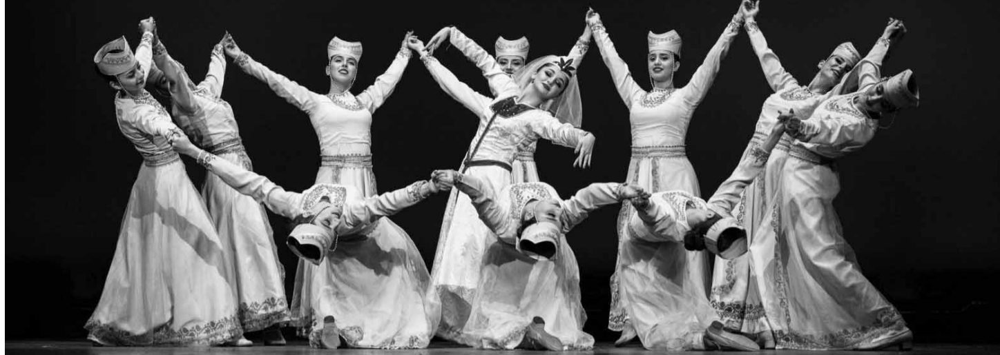
«Պարն այդպեսով է յուրաքանչյուր ազգի բնորոշ գծերը, մանավանդ բարձր ու քաղաքակրթության աստիճանը»: