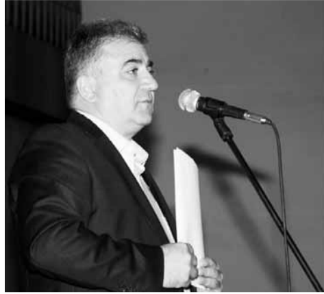
պատճառով և ձգձգվում է տնօրենի ընտրությունը: Այսինքն՝ թող լինի՝ ով կամենում է, բայց ոչ Կարոյան Քոչարյանը...

Պարզվում է՝ Կապանում չկա ուրիշ մեկը, որ ունենա հավաստագիր՝ տնօրենի թափուր տեղի մրցույթին մասնակցելու համար, ինչի