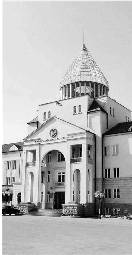
ղովրդի ինքնորոշման իրավունքը:

Արցախի Հանրապետության Ազգային ժողովի խմբակցությունները, արտահայտելով ժողովրդի կամքն ու դիրքորոշումը, պահանջում են Հայաստանի Հանրապետության իշխանություններից հավատարիմ մնալ ՀՀ Գերագույն խորհրդի 1992թ. հուլիսի 8-ի որոշմանը և կասկածի տակ չդնել Արցախի ժո-