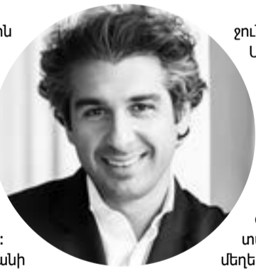
ՍԵՐԳԵՅ ՍՄԲԱՏՅԱՆ Գեղարվեստական ղեկավար և գլխավոր դիրիժոր

Կապանի միջազգային երաժշտական փառատոնի համերգային երկրորդ օրն արվեստի բոլոր երգեհոնային դահլիճը լեվ-լեցուն էր: Երաժշտասերը եկել էր բարձրակարգ երաժշտություն ունկնդրելու ակնկալիքով, ինչը միանգամայն իրականություն դարձավ: Բեմահարթակում Հայաստանի պետական սիմֆոնիկ նվագախումբն էր (գեղարվեստական ղեկավար և գլխավոր դիրիժոր՝ Սերգեյ Սմբատյան): Համերգային ծրագրի սկզբում հնչեց Սոցարտի «Ֆիգարոյի ամուսնությունը» օպերայի նախերգանքը, դաշնամուրի և նվագախմբի համար գրված N 21 դո մաժոր կոնցերտը: Այնուհետև հնչեց Մարտին Ուլիխանյանի «Հայկական ռապսոդիան»՝ թավջութակի և լարայինների համար, արիաներ Սոցարտի, Ջամոկո Պուչինիի և Ալֆրեդո Կատալինիի «Վալի» օպերաներից: Հանդիսատեսը հատկապես բուռն ծափոջուցումներով և օվացիայով վարձատրեց նվագախմբին, որը կատարեց Արամ Խաչատրյանի «Վալսը»՝ Միխայիլ Լերմոնտովի «Դիմակահանդես» դրամայի համար գրված երաժշտությունից: Եվ որպես հավարտ համերգի՝ հնչեց մի գեղեցիկ ստեղծագործություն՝ Առնո Բաբաջանյանի «Սերենադը»՝ Մարտին Ուլիխանյանի մշակմամբ: Համերգային երեկոյին հանդիսատեսը ծաղիկներով և սրտաբուխ ծափերով ող-