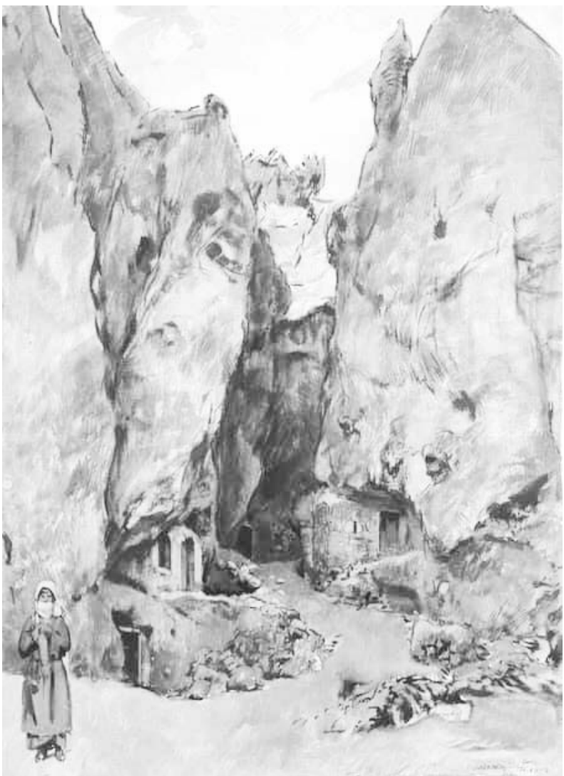
Եվզենի Լանսերե, Քարայրի բնակիչներ. Չանգեզուր (1926), թուրք, տեսակերպ

Թթենու տակ սեղան գցեցին՝ հյուրին հաց տալու: Այգի մտած մարդիկ հարգանքով բարևում էին հյուրին, հորս հարցնում.