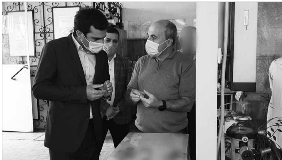
«Գորիսի Գամմա» ԲԲ ընկերությունում

տանքային այցի շրջանակներում այցելեց նաեւ Գորիս: