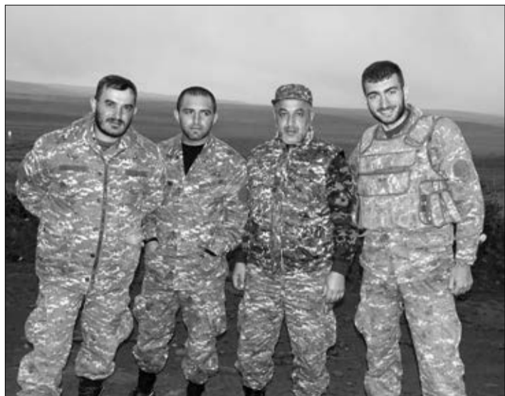
տում է, կարիներտներից, տաբուկ անկյուններից հայրենասիրություն բարոզելն այլեւս ամոթ է, առավել ամոթ է զորակոչից խուսափելը եւ թամաշավորի կեցվածք ընդունելը: Մինչեւ նոր հանդիպում...»:

Իսկ ես գնում եմ պարտքի գիտակցումով: Հիմա մեր տեղը ճակատում է, կարիներտներից, տաբուկ անկյուններից հայրենասիրություն բարոզելն այլեւս ամոթ է, առավել ամոթ է զորակոչից խուսափելը եւ թամաշավորի կեցվածք ընդունելը: Մինչեւ նոր հանդիպում...»: