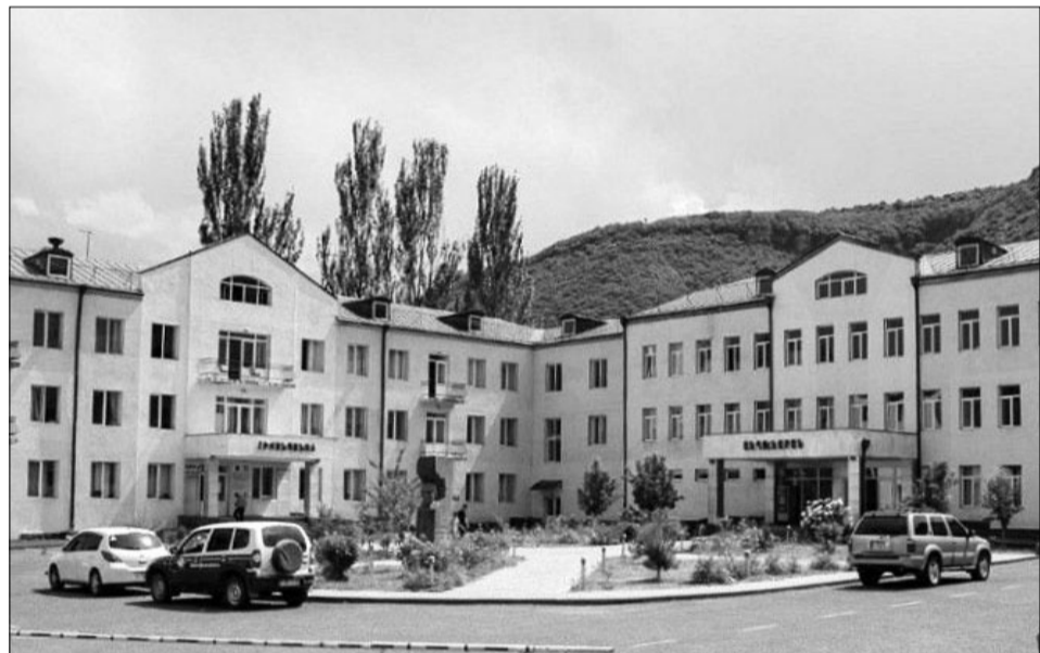
հնարավորության դեպքում՝ նորից մարտադաշտ մեկնեն: