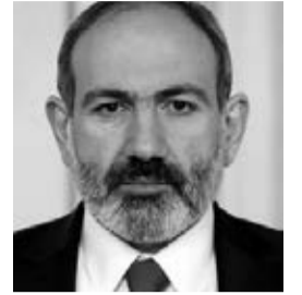
Վարչապետ Լիկոլ Փաշինյանը մարտակոչով է դիմել վերջին մեկ տարում զորացրված մեր զինվորներին

«Գիտեք, որ Հայաստանում հիմա ռազմական դրություն է հայտարարված և հիմա մարդիկ կանչվում են զորակոչի, զորահավաքային խնդիր են լուծում: Խնդիրն այն է, որ մեր օրենսդրությամբ վերջին մեկ տարվա ընթացքում ծառայությունն ավարտածները, այսինքն՝ նրանք, ովքեր վերջին մեկ տարում են զորացրվել, իրենք ենթակա չեն զորակոչի: Եվ խնդիրն այն է, որ այսօր հայրենիքն ունի այդ մարդկանց կարիքը: Տղերք, հայրենիքն այսօր ունի ձեր կարիքը», – ասաց Լիկոլ Փաշինյանը: