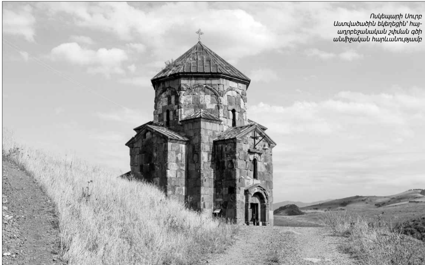
Ոսկեպարի Սուրբ Աստվածածին եկեղեցին՝ հայ-ադրբեջանական շփման զծի անմիջական հարևանությամբ