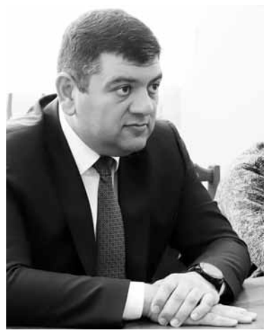
ԳԵՎՈՐԳ ՓԱՐՄՅԱՆ ԿԱՊԱՆԻ ՀԱՄԱՅՆՔԱՅԻՆ

Նոյեմբերի 14-ի և ապրիլի 30-ի Ազգային ժողովի հերթական նիստերի ժամանակ՝ Սյունիքի մարզից ընտրված Աժ պատգամավոր Մարինա Ղազարյանն արդեն երկրորդ անգամ օգտագործելով երկրի բարձրագույն ամբիոնը, խոսում է Ազգային և Դիցմայրի գյուղերի ջրամատակարարման խնդրի մասին՝ գաղափար չունենալով և չիմանալով նշյալ խնդիրների լուծմանն ուղղված ինչ քայլերի հաջորդականության, ինչ առավել ևս իրականացված աշխատանքների մասին: