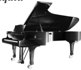
գային մրցույթի դափնեկիր երգեհոնահարուհի Իրինա Ռոզանովան հնչեցրեց Յոհան Սե-

բաստիան Բախի «Ֆանտազիա և ֆուգա սոլ միևոր» ստեղծագործությունը: