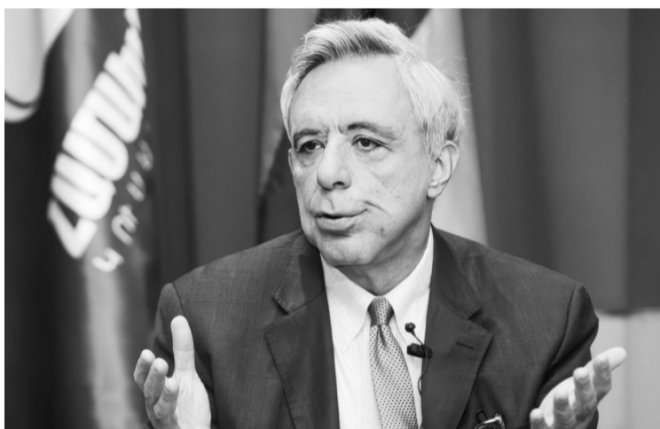
Վարդան Օսկանյան ՀՀ արտաքին գործերի նախարար 1998-2008թթ.

3.9. Տարածված փաստաթղթում չի երևում, թե ով է հայկական կողմից ստորագրել հուլիսից: Սակայն, ըստ համացանցում տարածված տեղեկությունների, հուլիսից մեր կողմից ստորագրել է ՀՀ պաշտպանության՝ այդ օրերի նախարար Վաղարշակ Չարությունյանը: