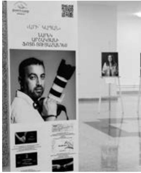
հնարավորություն սովեցիք ձեր միջոցով ներկայացնել Կապանը: Ասեմ, որ այս ցուցահանդեսը կազմակերպվել է նաև Երևանում, ցուցահանդեսի այցելուները հետաքրքրվում էին ձեզանով, մենք շատ-շատերին պատմել ենք բոլորիդ մասին, ձեր միջոցով մարդիկ փորձել են ճանաչել Կապանը: Յուսով եմ այդ մարդիկ

Կապանի մշակույթի կենտրոնի նախարահում Նոյեմբերի 24-ին բացվեց «Արի Կապան» խորագրով ցուցահանդեսը՝ «Gastronomic Camp Armenia» նախագծի շրջանակում: Դեռևս հոկտեմբերի 3-ին Երևանում կայացավ նախագծի առաջին այցեբարտային լուսանկարների ցուցադրանքը: Ֆոտոնախագծի շրջանակում Կապանն ու կապանցիները կայացվել էին տաղանդավոր լուսանկարիչ Լարեն Արշակյանի աչքերով, ում աշխատանքները լայն ճանաչում ունեն Յայաստանում ու սփյուռքում: