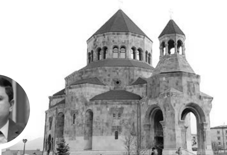
Ստեփանակերտի Սուրբ Աստվածածին եկեղեցին

տարների մոտեցումներում Արցախի հարցը զուտ շահարկումների և Ադրբեջանի վրա ազդելու ճնշման միջոց է, ապա դրա հետ կապված արձագանքը պետք է լինի կոշտ և զսպող»,- գրել է նա: